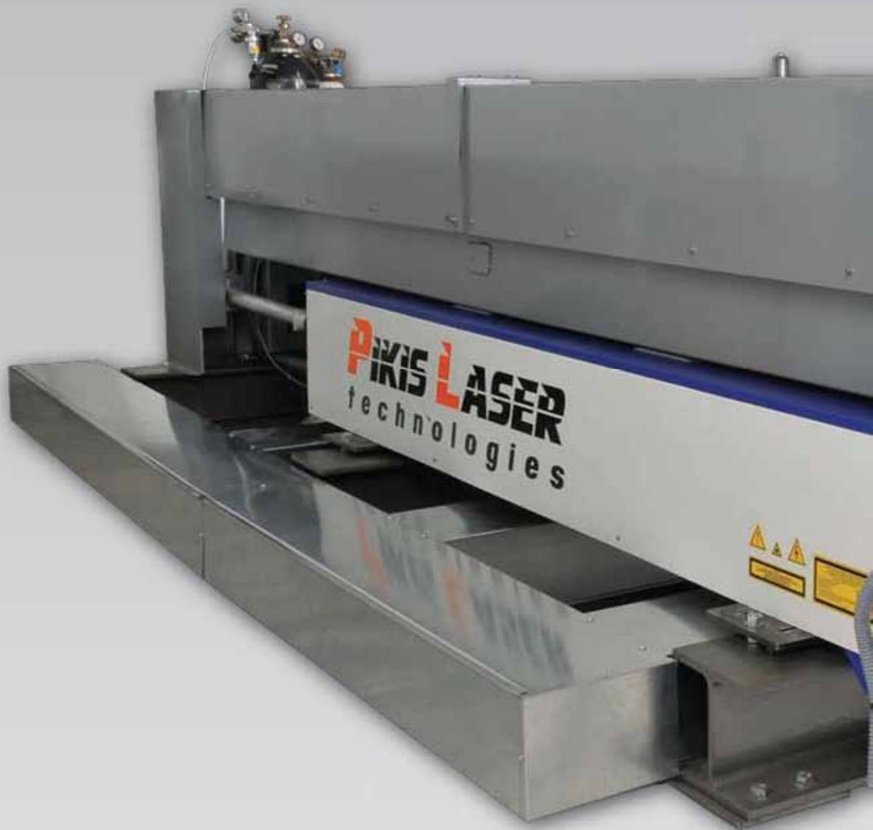
Εικονιζόμενη μηχανή FL 3015 500W , χωρίς παλέτα